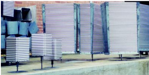
Type FKK avec réglage en hauteur Tipo FKK con regolazione in altezza